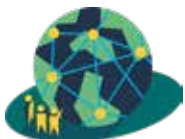
Klimatneutral och klimatresilient transportinfrastruktur

I grupperna ska eftersträvas en relevant och bred bemanning med representanter från så många olika Medlemskategorier. Vid behov kan representanter från icke-medlemmar erbjudas plats i Fokusområdesgrupperna.