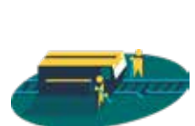
Hållbart underhåll av transportinfrastruktur