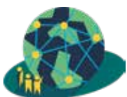
Klimatneutral och klimatresilient transportinfrastruktur

I grupperna ska eftersträvas en relevant och bred bemanning med representanter från så många olika Medlemskategorier. Vid behov kan representanter från icke-medlemmar erbjudas plats i Fokusområdesgrupperna.