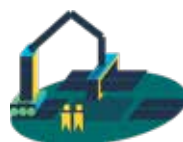
Material, konstruktionslösningar och byggmetoder